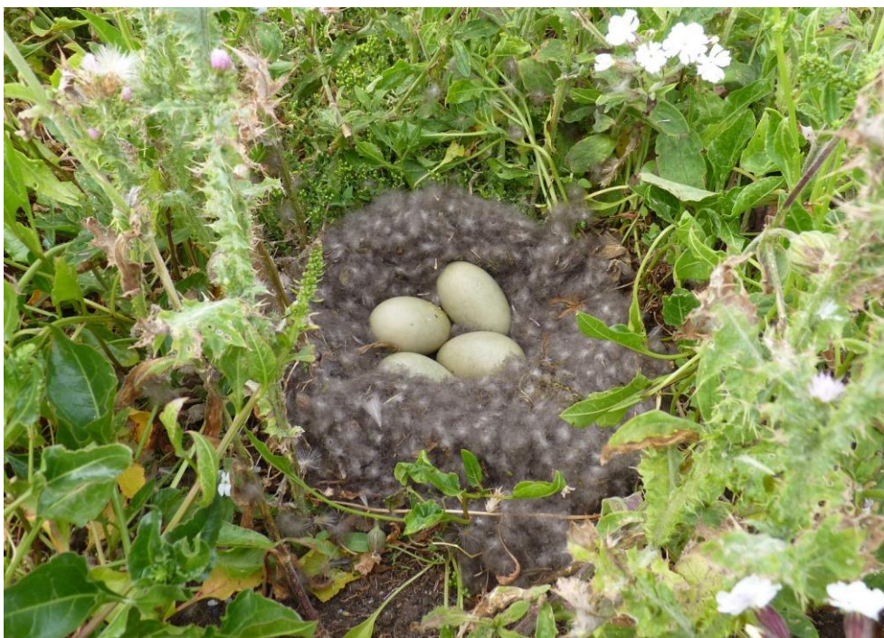
Photo 2 : nid d'eider avec 4 œufs (ponte complète à six) dissimulé dans les Chardons à petits capitules Carduus tenuiflorus et Compagnons blancs Silene latifolia (Dumet mai 2020)

Contrairement à cette situation d'un nid dissimulé sous le couvert végétal, celui posé (photo 2) à même la roche est très probablement plus exposé à la prédation par les goélands sp. lorsque la femelle est dérangée et doit abandonner son nid sans avoir le temps de recouvrir les œufs de duvet. Malheureusement, ce sont ces nids-là qui font le plus souvent l'objet d'un dérangement par les promeneurs ou les pêcheurs à pieds qui circulent préférentiellement sur cette partie de l'île.